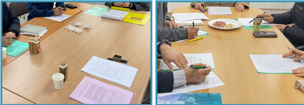
그림 1. 전문가 FGI 모습

인터뷰를 시작하기 전 연구 참여자에게 안내 사항(연구 목적·연구 내용·개인정보 처리 방법·연구 참여자의 권리) 설명을 충분히 제공하였으며, 수집된 FGI 자료는 모두 녹취하여 전사본으로 정리한 후 총 1,157개 발화 단위로 분석하였다. 별도로 사전 서면 질문지 배포 및 수합을 통해 기초 정보 및 FGI 구조화에 활용하였다.